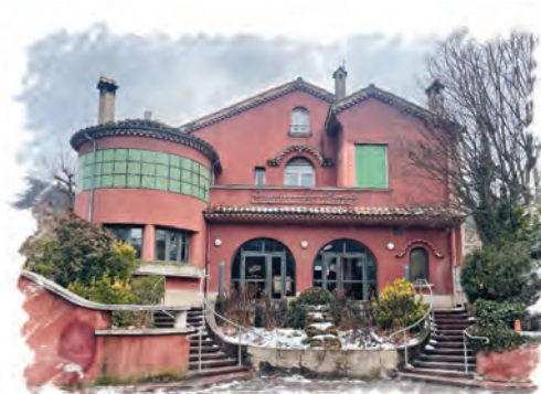
Cinéma Le Pestel, av. de la division du Texas