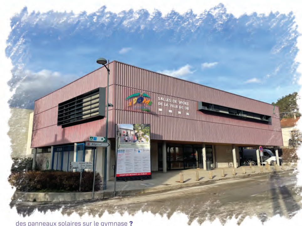
des panneaux solaires sur le gymnase ?

Réduire les coûts de chauffage par la mutualisation des locaux, le passage aux énergies renouvelables : chauffe-eau solaires, réseaux de chaleur.