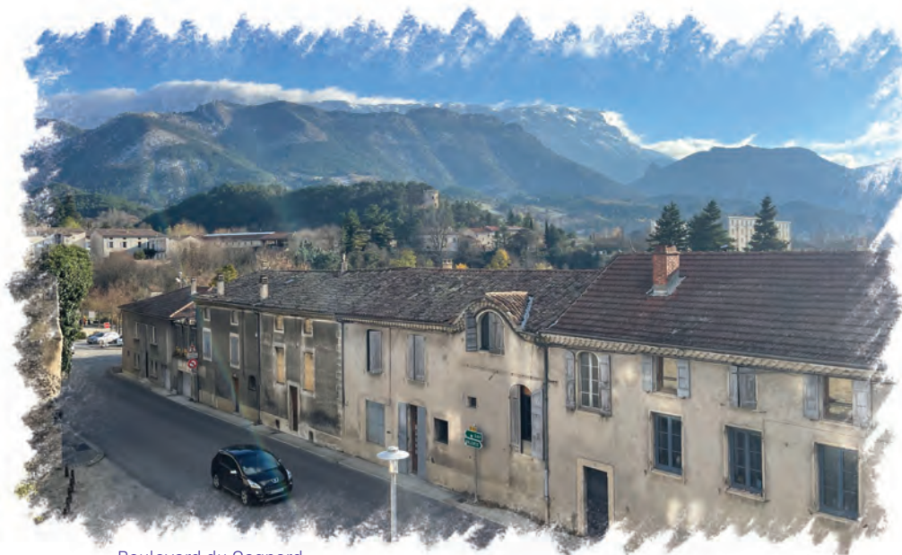
Boulevard du Cagnard

Inciter à la rénovation des locaux vacants, touristiques, insalubres et les passoires thermiques pour augmenter l'offre en logements permanents et dignes : fiscalité incitative, aides à la réhabilitation.