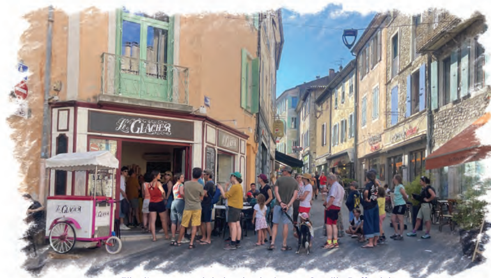
File d'attente en été chez le glacier, rue Camille Buffardel

Nous faciliterons les déplacements et livraisons adaptés à notre ville. Nous proposerons du logement abordable aux étudiant·es, salarié·es et saisonnier·ères.