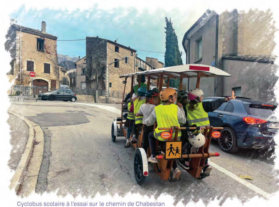
Cyclobus scolaire à l'essai sur le chemin de Chabestan

Protéger piétons et cyclistes sur la traversée Est-Ouest de la ville Avenue de la division du Texas, route de Ponet, avenue du Vercors : Créer des voies réservées, aménager les trottoirs, en concertation avec les riverain-es.