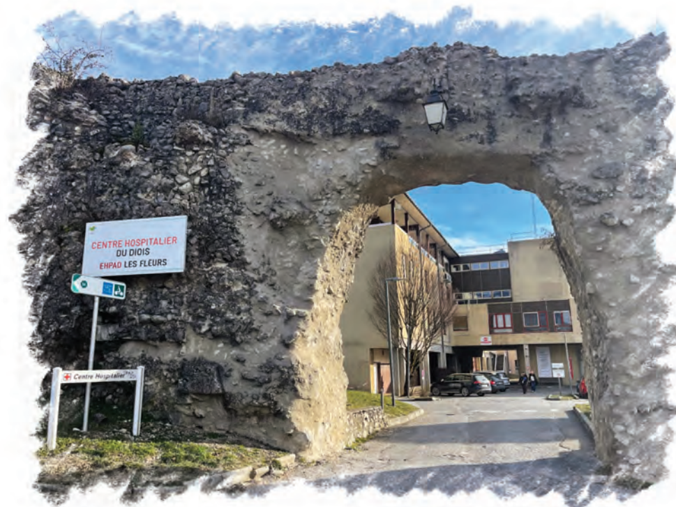
Entrée du centre hospitalier du Diois dans les remparts