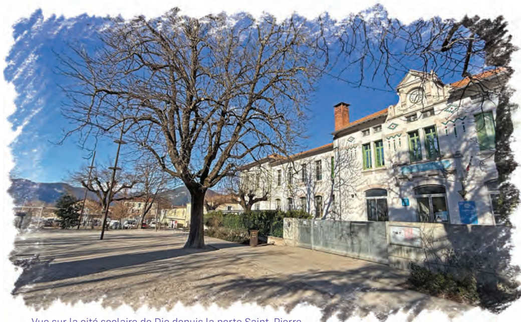
Vue sur la cité scolaire de Die depuis la porte Saint-Pierre

Renforcer médiation, présence humaine, équipements et réponses adaptés, pour une ville apaisée.