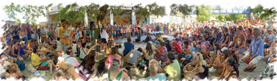
Public assistant au spectacle de la kermesse de l'école Chabestan

Permettre l'éducation tout au long de la vie : conférences et ateliers.