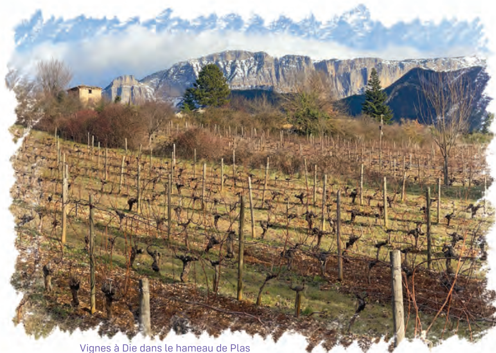
Vignes à Die dans le hameau de Plas

Rendre l'alimentation de qualité accessible à toutes et tous en soutenant les initiatives de lutte contre la précarité alimentaire.