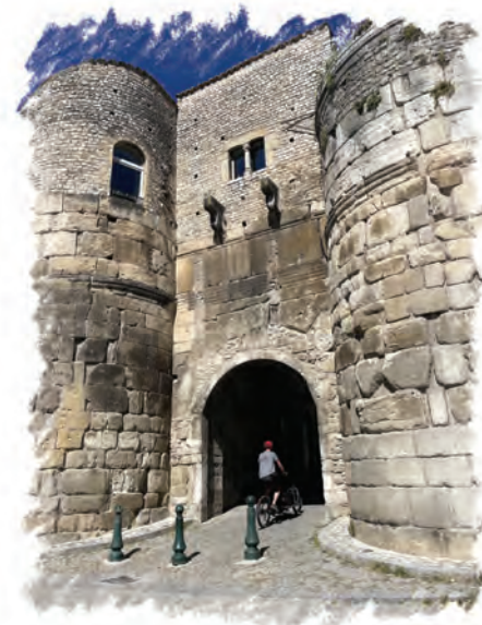
Porte Saint-Marcel, ancienne entrée de Die

Créer une fondation territoriale pour compléter les subventions.