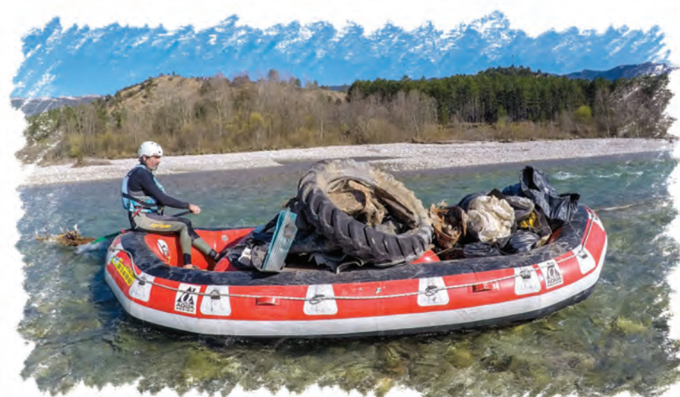
Initiative citoyenne de nettoyage de la rivière Drôme