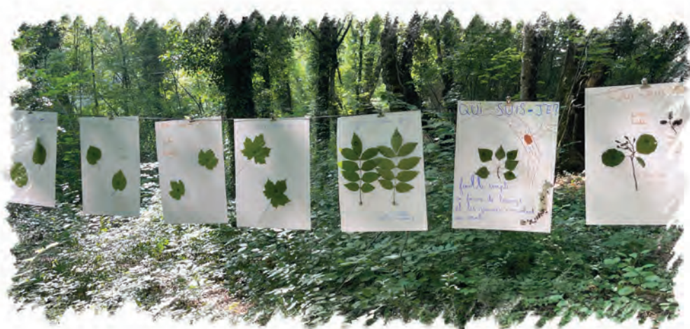
Pièce d'une l'exposition réalisée par les élèves de Chabestan lors d'un atelier pédagogique en nature

Dans tous les projets de la ville. Renaturer les espaces urbains. Sensibiliser et associer les habitants.