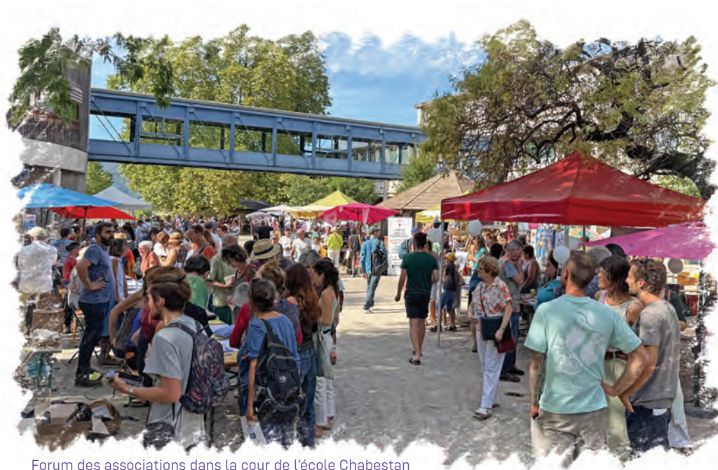
Forum des associations dans la cour de l'école Chabestan

Formation des élu-es et des personnels municipaux et intercommunaux.