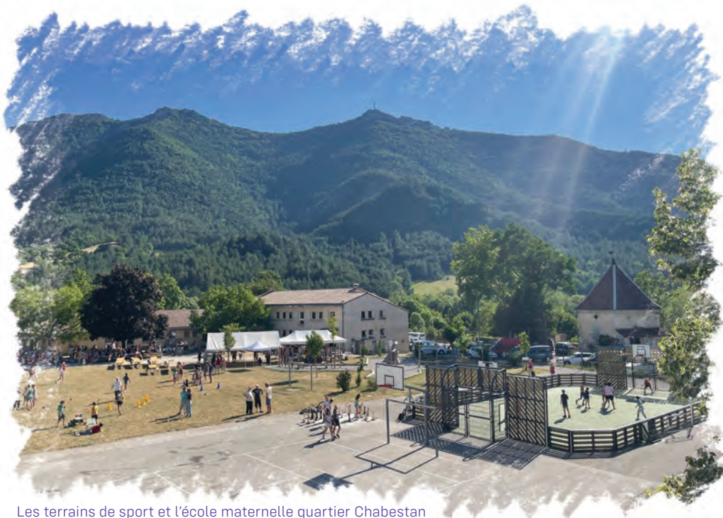
Les terrains de sport et l'école maternelle quartier Chabestan

Écoles et salle polyvalente rénovées, espaces sûrs partagés et ouverts, pour apprendre et s'émanciper à tout âge.