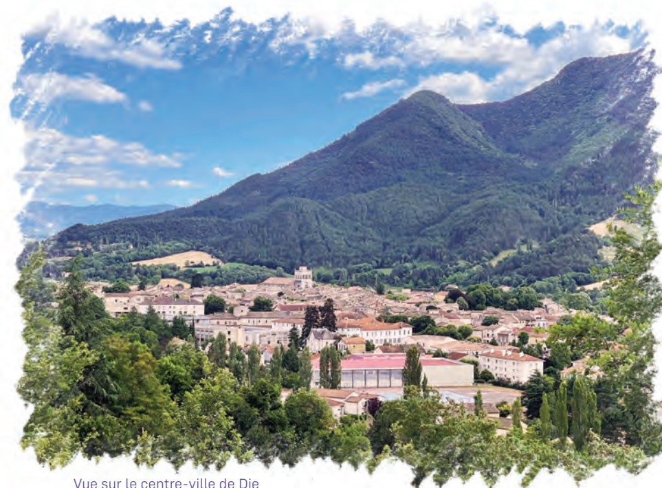
Vue sur le centre-ville de Die

Nous mutualiserons des moyens à l'échelle intercommunale pour réussir et financer ces chantiers.